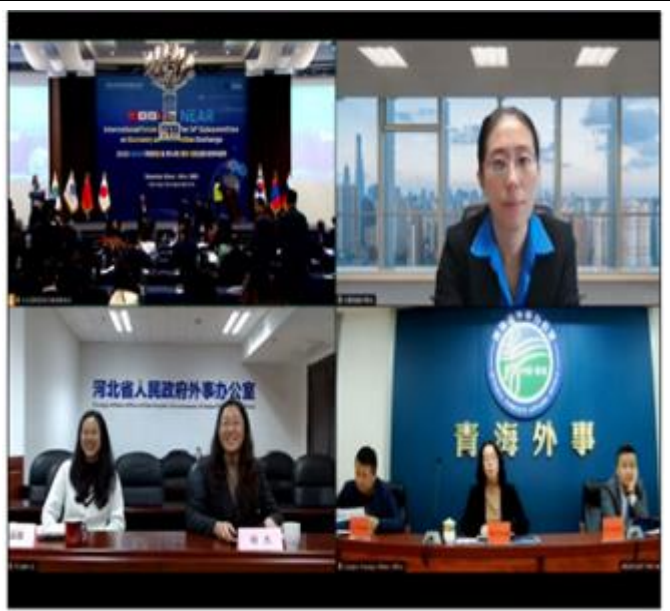
Tencent хурал Хятадаас онлайнгаар оролцов