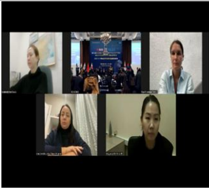
Zoom хурал Орос, Японоос онлайнгаар оролцов